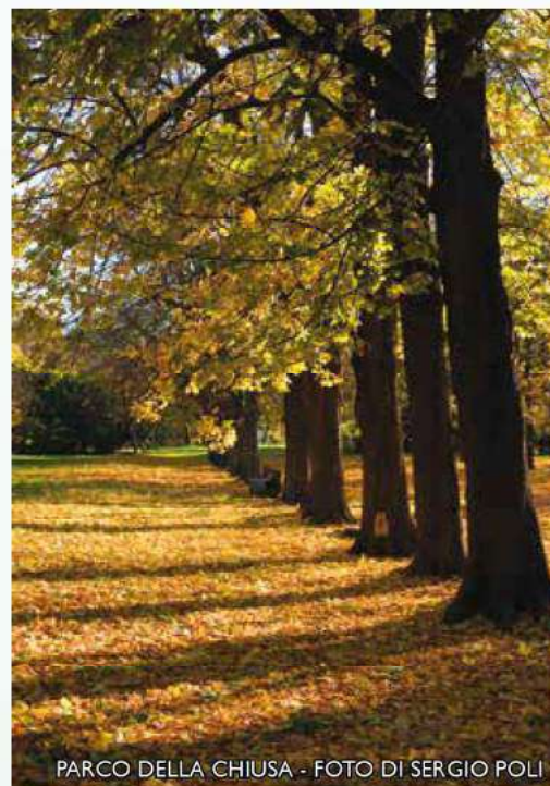
PARCO DELLA CHIUSA

Immagine della segnaletica che aiuterà a seguire il percorso