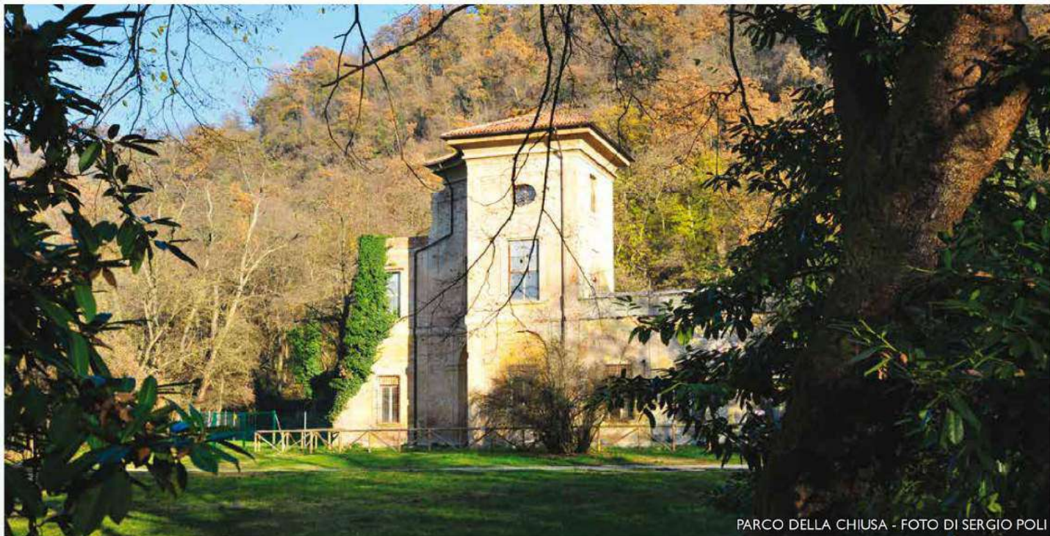
PARCO DELLA CHIUSA

(dal Patto Educativo del gruppo Escursionismo, Polisportiva Masi-Percorsi di Pace)